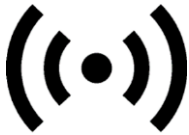
GP-30 o MF-7